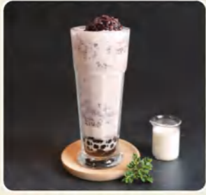
紫米紅豆珍珠鮮奶